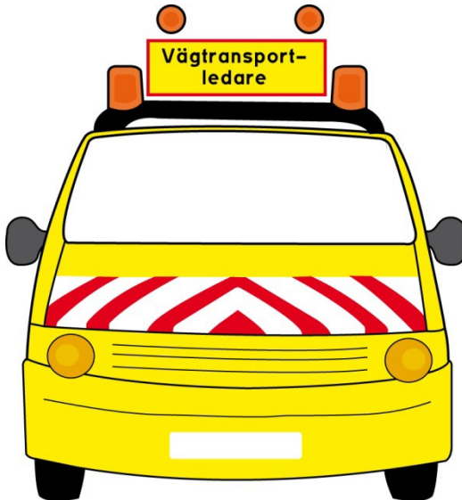
Figur 1. Röda fluorescerande och vita reflekterande fält framtill