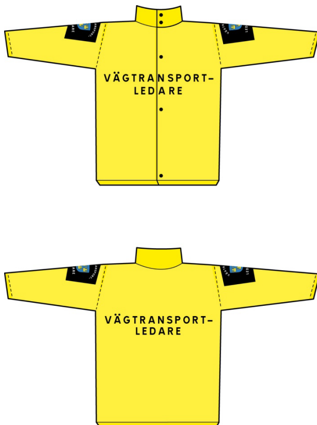
Figur 1. Överdels fram- och baksida.

Överdels ska förses med texten "VÄGTRANSPORTLEDARE" i versaler, centrerad på två rader, både på fram- och baksidan. Texten ska vara svart och cirka 5 cm hög. På framsidan får dock texten placeras på vänster sida med en mindre textstorlek (cirka 1,5 cm). Ett emblem ska finnas på båda ärmarna cirka 10 cm ned på armen från axelspetsen. Överdels får också ha kort ärm. Överdels ska uppfylla kraven i EN 471:2004 klass 3. Överdels ska vara gul, dock kan den nedersta delen ha samma färg som byxorna.