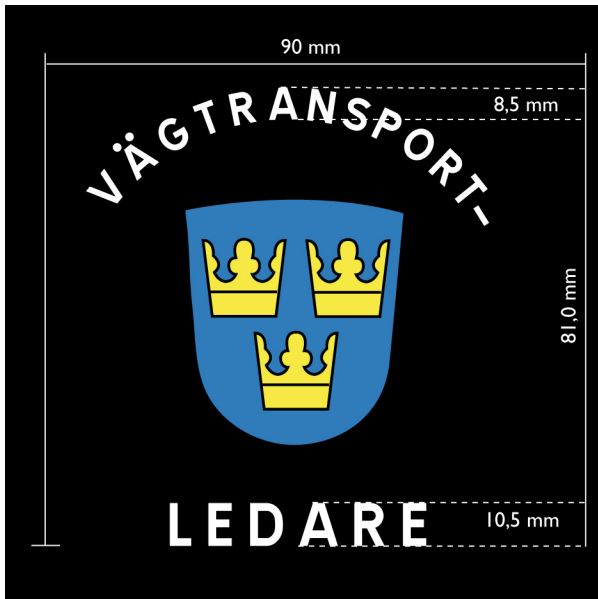
Figur 4. Ärmemblem

Emblemet ska ha svart botten och bestå av en blå sköld försedd med lilla riksvapnet och texten VÄGTRANSPORT- ovanför skölden samt texten LEDARE nedanför skölden. Sköldens höjd ska vara ca 5 cm och vara placerad centrerad mellan texterna. Emblemet ska finnas på båda ärmarna på jackan med emblemets övre kant cirka 10 centimeter från ärmsömmen vid axelspetsen. Ärmemblemet ska vara utfört i guld, blått, vitt och svart. Utseende och ytterligare mått framgår av figur 5 ovan