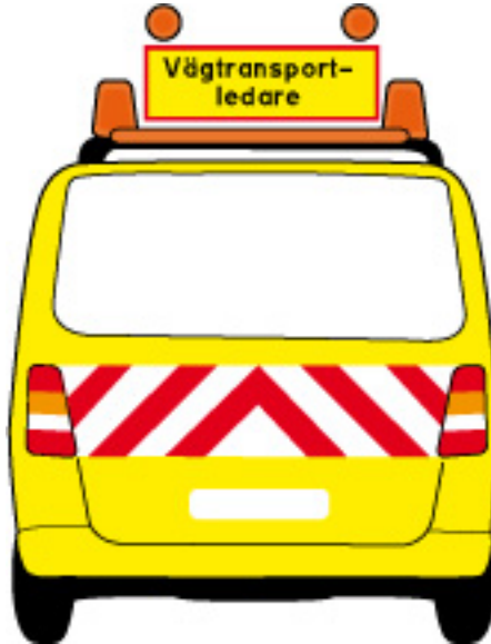
Figur 2. Röda reflekterande och vita fält baktill