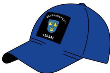
Figur 3. Mössa med skärm.

Byxorna ska vara mörkblå med hellånga ben. Byxorna ska uppfylla kraven i EN 471:2004 klass 1.